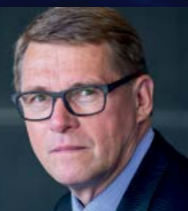
Matti Vanhanen Presidenttiehdokas