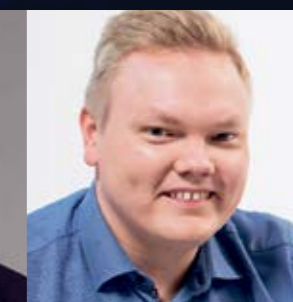
Antti Kurvinen Keskustan varapuheenjohtaja