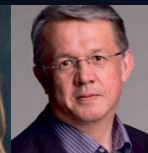
Juha Rehula Keskustan varapuheenjohtaja