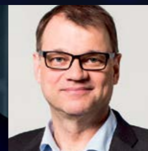
Juha Sipilä Keskustan puheenjohtaja